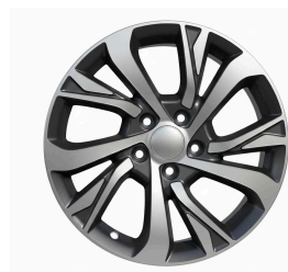
17" құйма дискілер