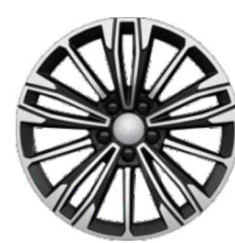
18" құйма дискілері